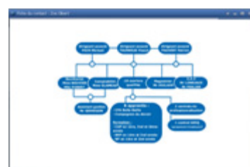
Schéma de service