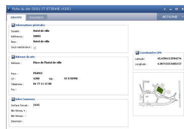
Rattachement au site