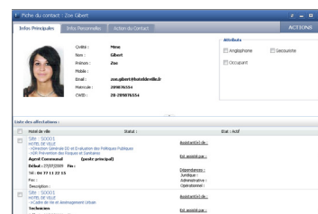
Fiche contact physique